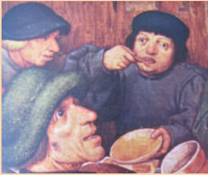
Esssituation von Pieter Breughel (15. Jh.)