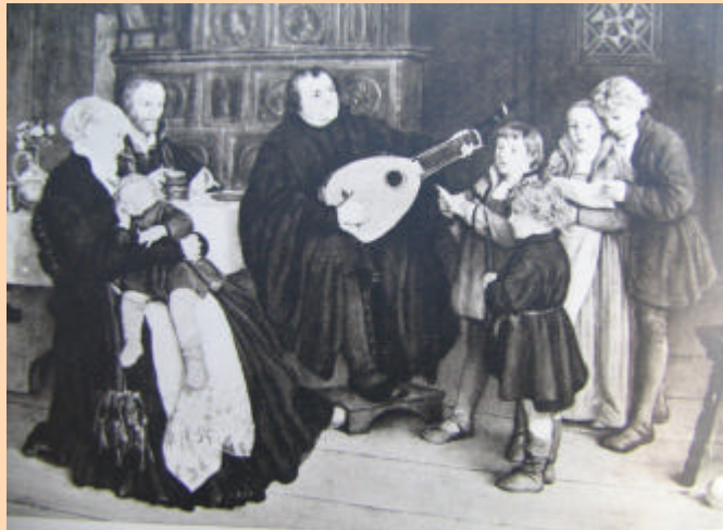
Luther im Kreis seiner Familie

Heute fühlen wir uns als Gäste von Martin und Katharina Luther. Wir begegnen dem Luther und der Lutherin beim Mahl in der "Alten Canzley", gegenüber der Schlosskirche. Wohl bekomm's bei Speis und Spruch.